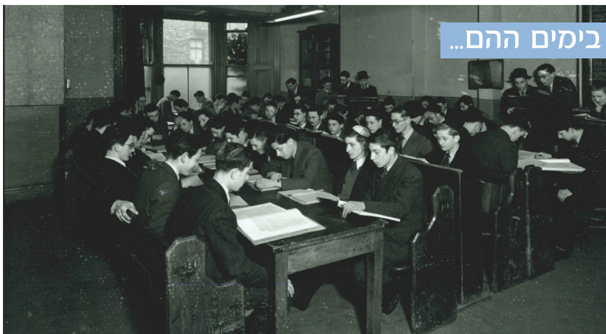
The early days... the first Beis Hamedrash