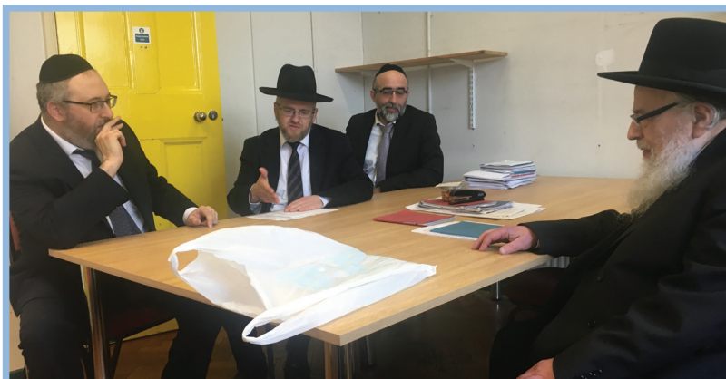
The Rosh HaYeshiva during a recent trip to London visiting the Hasmonean Beis and Menorah Grammar School.