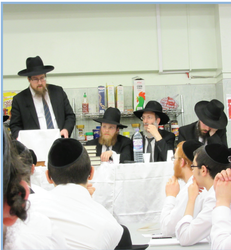
The Yeshiva held a technology awareness session for all Bochorim in advance of Summer Bein Hazemanim.