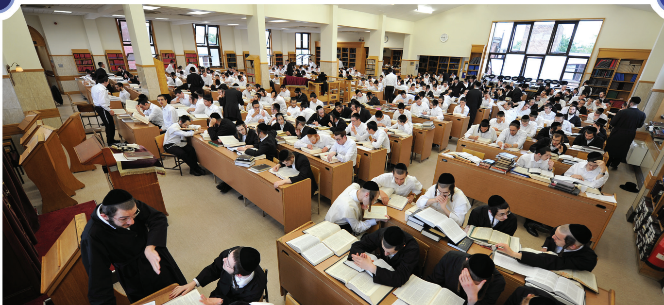
אלול תשע"ז Afternoon Seder